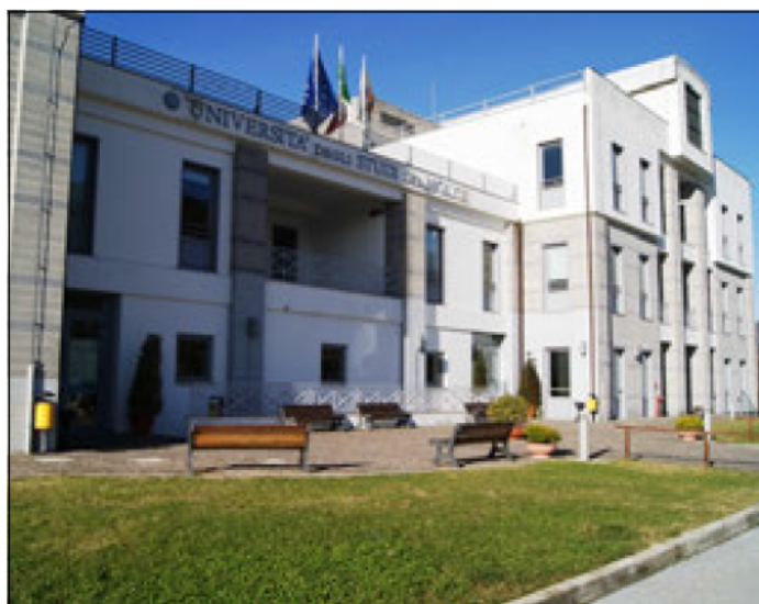
La sede universitaria di Pesche